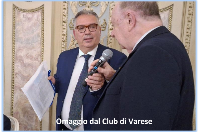
Omaggio dal Club di Varese