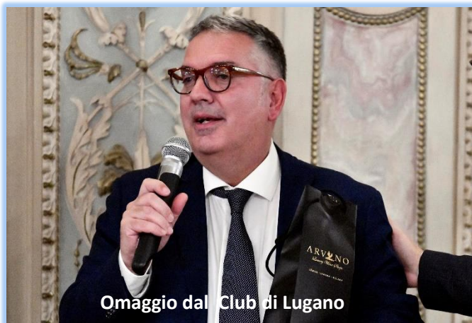
Omaggio dal Club di Lugano