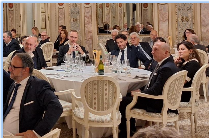
Tavolo Atene - Grecia 2004