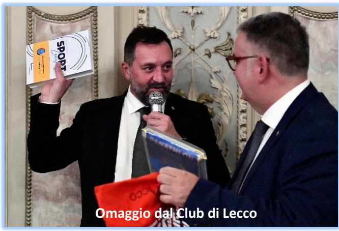
Omaggio dal Club di Lecco