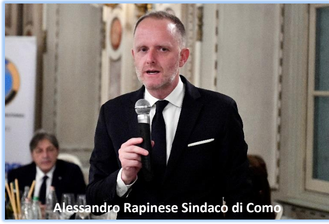
Alessandro Rapinese Sindaco di Como