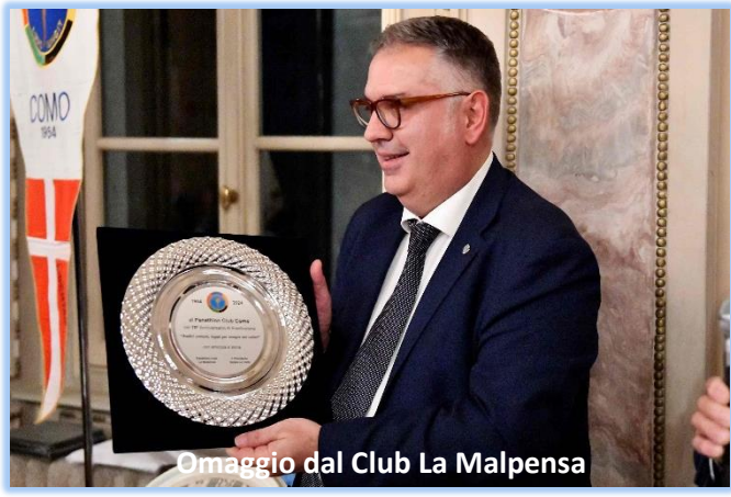
Omaggio dal Club La Malpensa