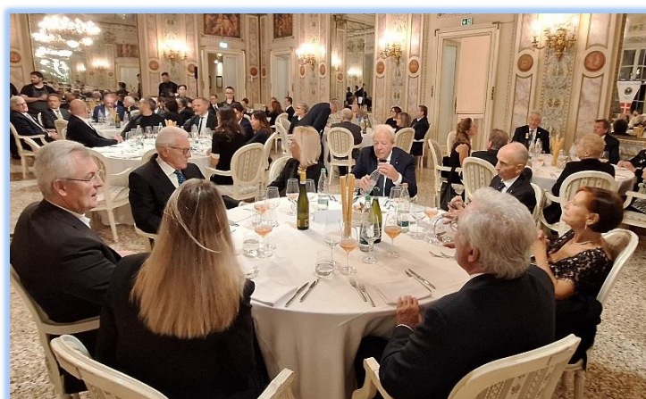
Tavolo Sydney - Australia 2000